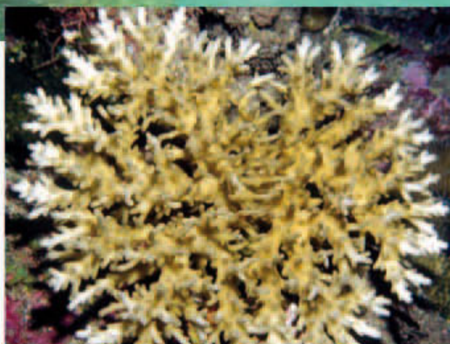
La bonne santé des coraux de Taha'a est manifeste, mais attention, quelques coups de palmes malheureux peuvent commettre l'irréparable.