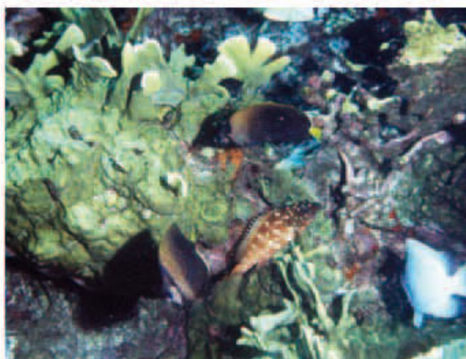
Valse de petits poissons colorés devant une colonie de corail de feu. Attention, ça pique !